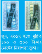
জুন, ২০১৭ হতে মুদ্রিত ১০০ ও ৫০০ টাকার নোটের নিরাপত্তা সূত্র।

০১। নিরাপত্তা সূত্রঃ ১০০, ৫০০ ও ১০০০ টাকা মূল্যমান নোটের নিরাপত্তা সূত্রায় বাংলাদেশ ব্যাংকের লোগো এবং নোটের মূল্যমান মুদ্রিত আছে যা নোট এদিক-ওদিক (Tilt) করলে দেখা যাবে। জুন, ২০১৭ হতে প্রচলিত ১০০ ও ৫০০ টাকা মূল্যমান নোটও এদিক-ওদিক করলে চলের বেনী সদৃশ নিরাপত্তা সূত্রের একটি অংশ (Band) লাল হতে সবুজ রংয়ে পরিবর্তন হবে এবং অপরটির সম্পূর্ণ অংশে বাংলায় লেখা নোটের মূল্যমান দেখা যাবে। সাধারণ আলোয় নোটের মূল্যমান আংশিক দেখা গেলেও টেবিল ল্যাম্প কিংবা টর্চ লাইটের নীচে নোট ধরলে পুরো Band জুড়ে মূল্যমান দেখা যাবে।